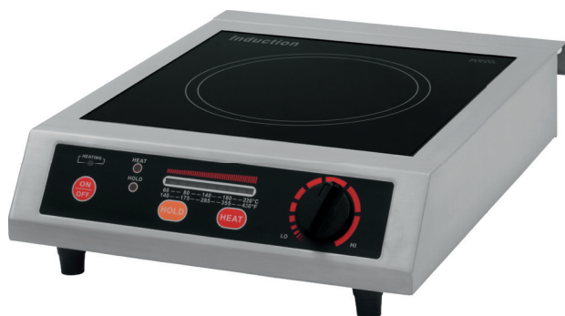
COLDFIRE CT 25