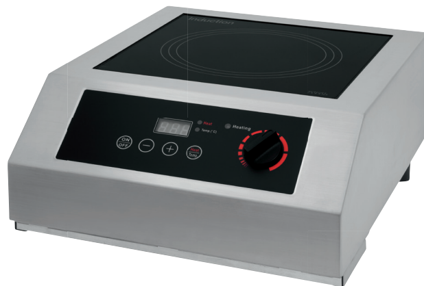
COLDFIRE CT 35