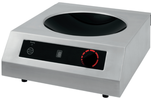
COLDFIRE CW 25