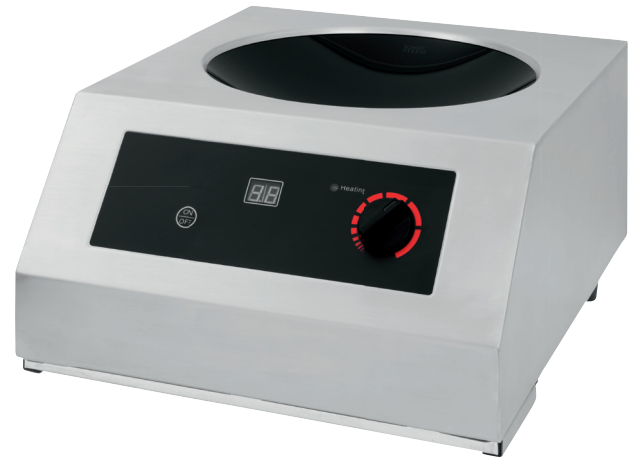
COLDFIRE CW 35